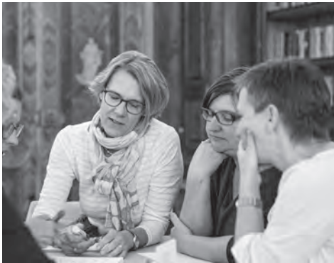
Teamtag im Kloster Fischingen