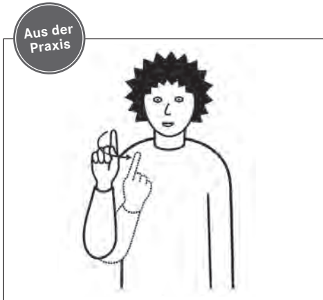
PORTA Gebärde «nochmals»

«Nochmal!» rufe ich laut und drehe dabei den nach oben gestreckten Zeigefinger im Kreis. Die Mutter und ich wiederholen das «Schiffli-Lied» nun bereits zum sechsten Mal – ihr Kind möchte aus dem dabei hin- und her schwingenden Tuch gar nicht mehr aussteigen. Wir singen und lachen, die Arme beginnen müde zu werden, aber die Freude über die gelungene Interaktion ist auf allen Seiten gross.