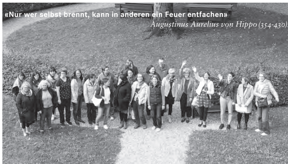
Teamtage im Kloster Fischingen

Den Jahresbeginn erlebten wir mit grosser Zuversicht: zwei Jahre Pandemie hatten wir soweit überstanden und die Arbeit mit Mund-Nasenschutz gehörte in den meisten Fällen der Vergangenheit an. Teamsitzungen, Weiterbildungen und Vernetzungstreffen fanden wieder «live» statt und wir genossen diese «Normalität» mit einer gewissen Leichtigkeit.