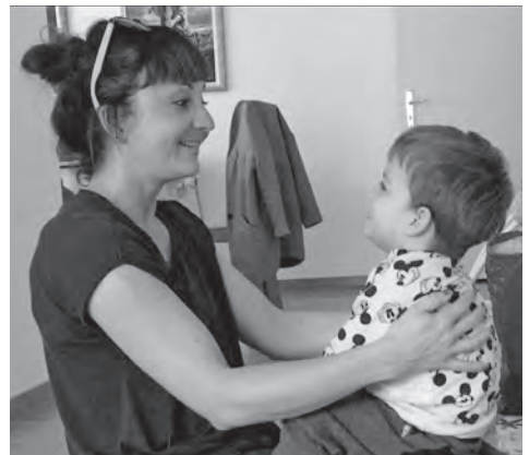
Joggeli, Joggeli, chasch au rite ...

Die Heilpädagogische Früherziehung ist immer an der Lebenswelt der Kinder orientiert: Sie findet zu Hause statt, in dem Umfeld, in dem das Kind sich am wohlsten fühlt und greift Interessen des Kindes auf. Singen und dazu passendes Bewegen sind interessant für fast alle Kinder. Mit Hilfe der Singspiele können sogar oft solche Kinder erreicht werden, die sich schwer tun, in soziale Interaktion zu treten (bspw. Kinder mit einer Autismus-Spektrum-Störung).